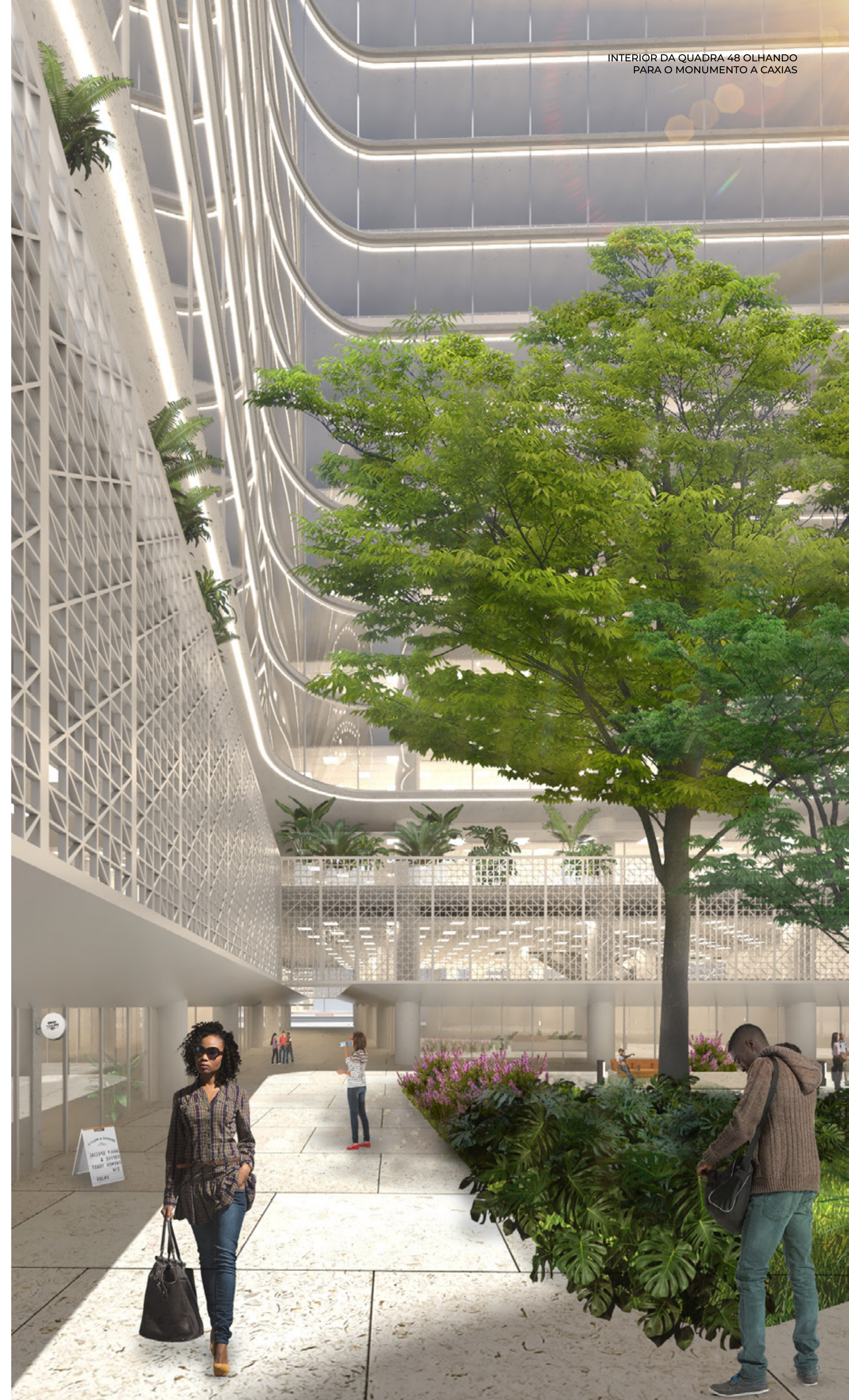
INTERIOR DA QUADRA 48 OLHANDO PARA O MONUMENTO A CAXIAS